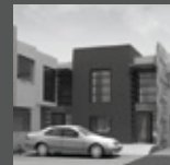
CONDOMINIO DEL SOL II La Molina