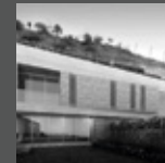
EL REFUGIO La Molina