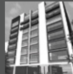
PARQUE DEL SUR II San Borja