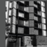
SAN IGNACIO DE LOYOLA Miraflores