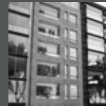
MELITÓN PORRAS 110 Miraflores