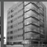
GENERAL IGLESIAS Miraflores