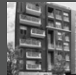
AVENDAÑO 151 Miraflores