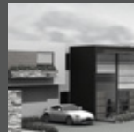
CONDOMINIO DEL SOL III La Molina