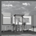
CONDOMINIO DEL SOL La Molina