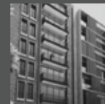
SANTA ISABEL Miraflores