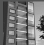
PARQUE CHOPIN San Borja