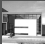
LA ESTANCIA La Molina