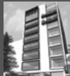
PARQUE DEL SUR San Borja